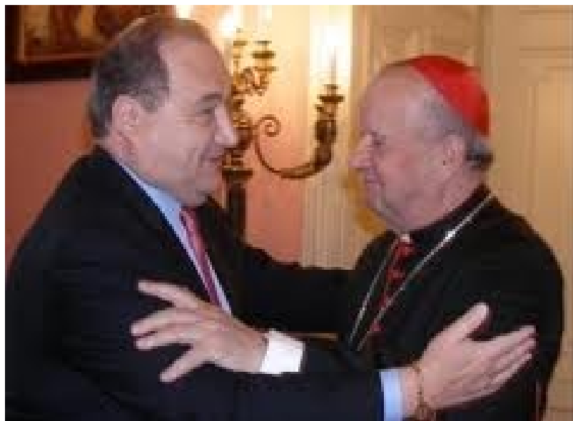
26.05.2010r – Foxman (szef ADL – Anti Defamation League, organu B'nai B'rith) i kard. Dziwisz podczas odbierania nagrody im. Kard. Augustyna Bea.

26.05.2010r kard. Stanisław Dziwisz odebrał nagrodę im. Kard. Augustyna Bea, przyznaną mu przez B'nai B'rith.