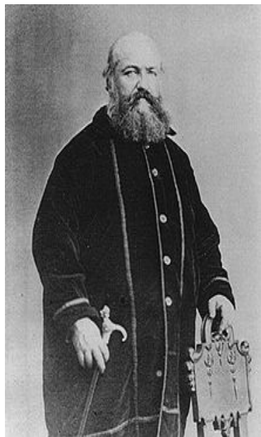
Eliphas Lévi Zahed, - po lewej

Udoskonalony portret Baphometa - Lucyfera (patrz poniżej) sporządził na tej postawie mason kabalista, Eliphas Lévi Zahed (1810-1875).