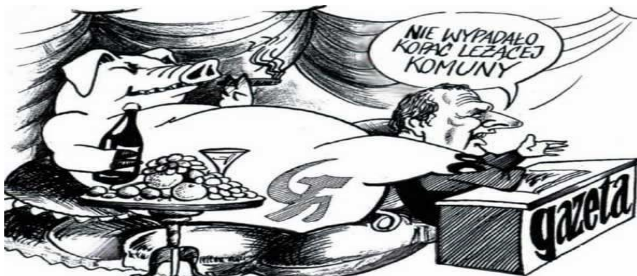
Na zdjęciu karykatura (a może rzeczywistość) Gazety Wyborczej (wybiórczej).

z pełnym poszanowaniem i respektem dla autorów, wydawców i praw autorskich, w dzisiejszych czasach powszechnego przemilczania i fałszowania historii i faktów historycznych, uważamy za szczególnie ważną powinność i obowiązek rozpowszechniania informacji, celem edukacji i uświadamiania, oraz bezpartonowej walki z owymi przemilczeniami i fałszami.