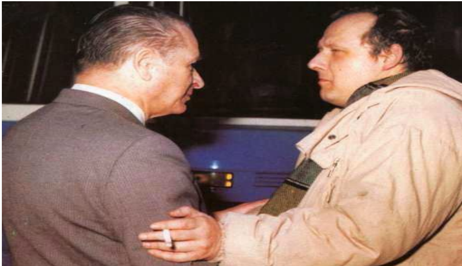
Na zdjęciu od lewej strony: szef SB gen. Czesław Kiszczak, Adam Michnik - Aaron Szechter