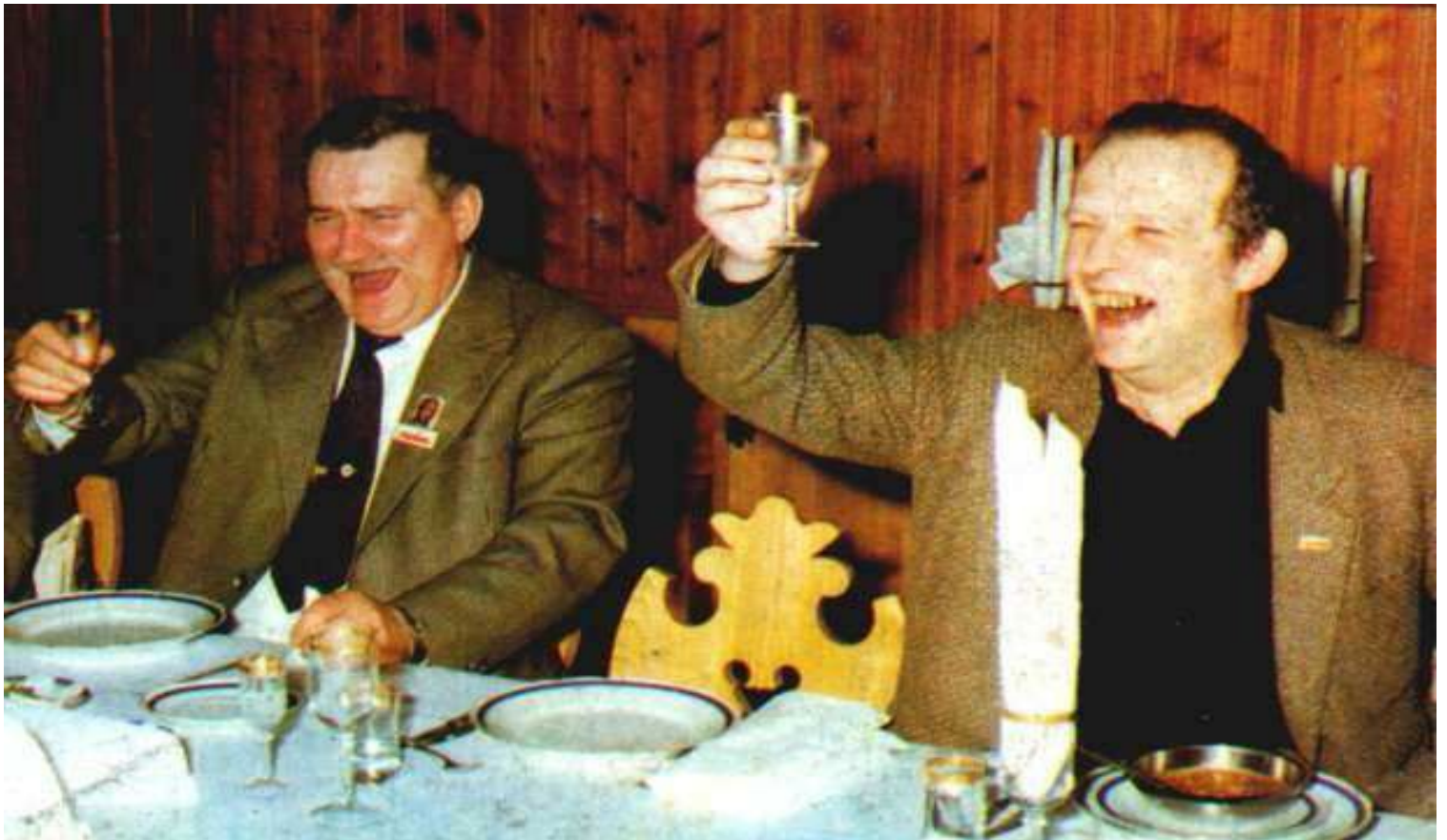
Na zdjęciu od lewej strony: Lech Wałęsa - Lejba Kohne, Adam Michnik – Aaron Szechter