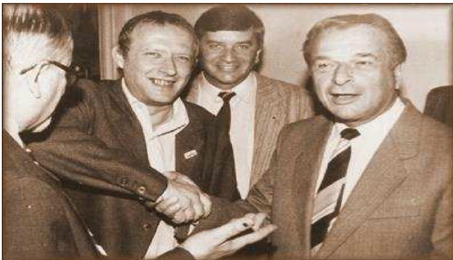
Koncesjonowany "opozycjonista" i nihilista Adam Michnik (Aaron Szechter) – na zdjęciu po lewej stronie, wraz z gen. SB Czesławem Kiszczakiem – na zdjęciu po prawej stronie